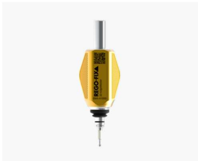
製品情報や検査証明書にアクセスする為のQRコード